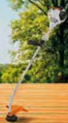
FS 38 DESBROSSADORA