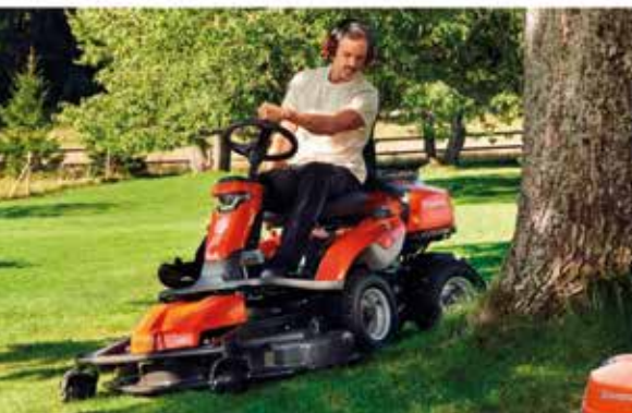
Rider HUSQVARNA R214TC Comfort