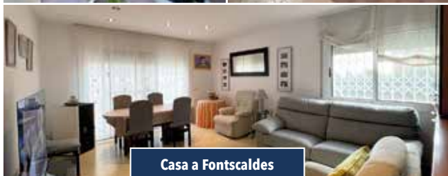
Casa a Fontscaldes

CASA AMB JARDÍ. Garatge, jardí, 4 habitacions i 2 banys. Cuina amb sortida al jardí. Disposa de golfes i calefacció. Entorn molt tranquil a 2 min. de Valls. Preu: 285.000€