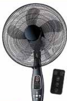
VENTILADOR DE PEU AMB COMANDAMENT