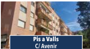
Pis a Valls C/ Avenir

NAU DE 215M2. Planta baixa amb oficines i sala taller, primera planta despatx de direcció i sala de juntes. Accés per a dos carrers. Preu: 750€