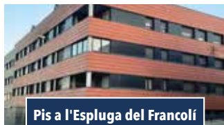
Pis a l'Espluga del Francolí

CASA AMB JARDÍ. Garatge, jardí, 4 habitacions i 2 banys. Cuina amb sortida al jardí. Disposa de golfes i calefacció. Entorn molt tranquil a 2 min. de Valls. Preu: 285.000€