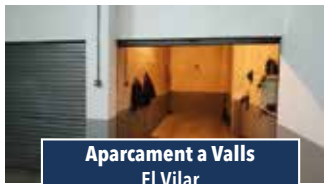
Aparcament a Valls El Vilar

PIS MOLT NOU AMB APARCAMENT. Pis molt ampli de 3 hab., una tipus suite, ampli menjador amb balcó i cuina office. Tot exterior, calefacció. Edifici de recent construcció amb asc. Preu: 185.000€