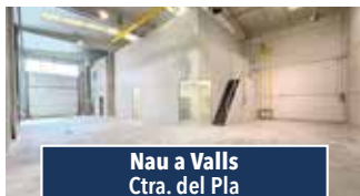
Nau a Valls Ctra. del Pla

PIS PER ACTUALITZAR. 132m2, gran menjador amb balcó. Cuina amb eixida. 2 banys complets, 4 habitacions i rebost. Calefacció i ascensor. Preu: 195.000€