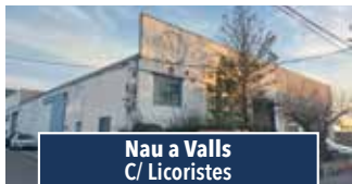
Nau a Valls C/ Licoristes

LOCAL situat a un carrer perpendicular a l'Avenir. Disposa de dos despatxos, recepció, bany i arxiu. Idoni per professionals lliberals. Preu: 450€