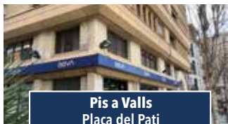
Pis a Valls Plaça del Pati

APARCAMENT TANCAT. Bona zona, aparcament privat tancat. Preu: 31.500€