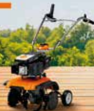
MH 445 MOTOAIXADA