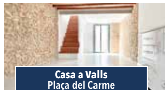
Casa a Valls Plaça del Carme

NAU DE 300M2. Planta baixa zona de treball i magatzem. 1ª planta oficines i altell polivalent. En perfecte estat per iniciar activitat. Oficina de 34m2. Preu: 190.000€