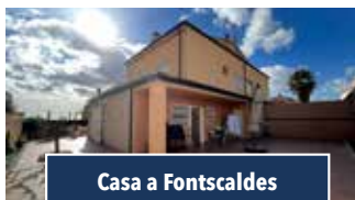
Casa a Fontscaldes

PIS DE 3 HABITACIONS. Ampli menjador assolellat amb balcó tancat, cuina amb eixida. Calefacció, edifici amb ascensor i escala familiar. Preu: 155.000€