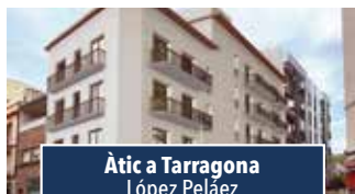
Àtic a Tarragona López Peláez

PIS PER ACTUALITZAR. 132m 2 , gran menjador amb balcó. Cuina amb eixida, 2 banys complets, 4 habitacions i rebost. Calefacció i ascensor. Aparcament. Preu: 195.000€