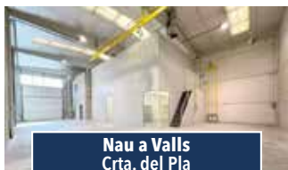
Nau a Valls Crta. del Pla

LOCAL PER MAGATZEM O APARCAMENT. Situat en un càrrec cèntric. De 113m 2 amb dues portes d'accés. Ocasió: 70.000€