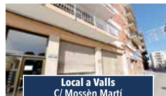
Local a Valls C/ Mossèn Martí

PIS AMB TERRASSETA POSTERIOR. Primer pis sense ascensor de 3 habitacions. Bany complet, menjador amb balcó i cuina. Reformat. Terrasetta al darrera amb rentador i rebost. Preu: 138.000€