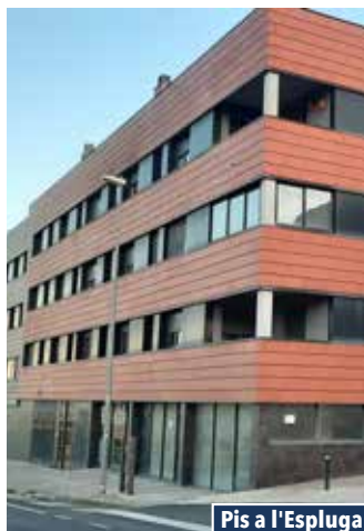
Pis a l'Espluga del Francolí Avda. Catalunya

PIS AMB APARCAMENT. Pis molt nou i ampli de 3 habitacions, una tipus suite, gran menjador amb balcó, cuina-office. Tot exterior. Calefacció. Edifici de recent construcció amb ascensor i zona comunitària. Preu: 185.000€