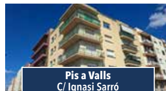
Pis a Valls C/ Ignasi Sarró

ÚLTIM ÀTIC. Obra nova al cor de Tarragona. 160m 2 , 3 hab. (1 suite), terrassa a la planta pis i segona terrassa. Promoció única d'alt standing en un edifici històric completament rehabilitat. Preu: 448.400€