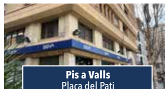
Pis a Valls Plaça del Pati

CASA AMB JARDÍ. Garatge, 4 habitacions i 2 banys. Cuina amb sortida al jardí. Disposa de golfes i calefacció. Entorn molt tranquil a 2 min de Valls. Preu: 285.000€