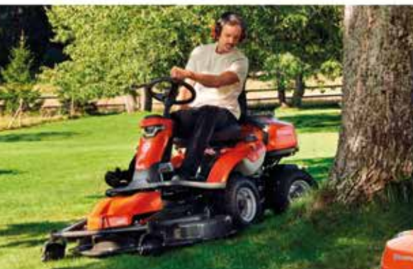
Rider HUSQVARNA R214TC Comfort