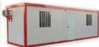
CASETES DE FUSTA