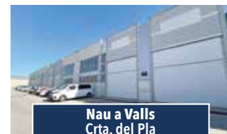
Nau a Valls Crta. del Pla

NAU DE 300M 2 . Planta baixa zona de treball i magatzem. 1 a planta oficines i altell polivalent. En perfecte estat per iniciar activitat. Oficina de 34m 2 . Preu: 190.000€